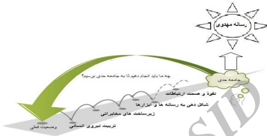
شکل ۲: ترسیم چشم انداز و گام‌های چهارگانه پس‌نگری ارتباطات

تربیت نیروی انسانی حرفه‌ای متعهد و معتقد برای اجرای کارهای بزرگ و مأموریت جهانی رسانه مهدوی، امری ضروری است. از این رو، شایسته است با برنامه ریزی و ارائه برنامه‌های آموزشی آینده نگرانه در این زمینه عمل شود: