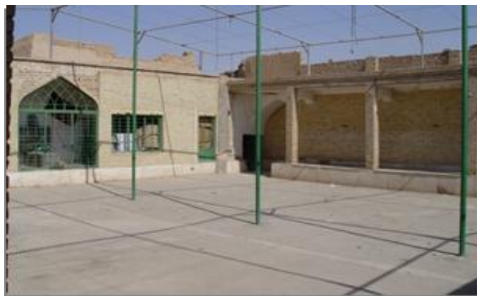
شکل ۶: حسینیه گلچینان