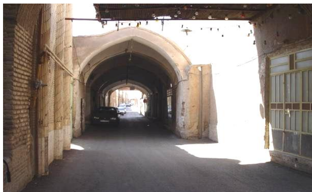
شکل ۸: بازارچه هاشم خان