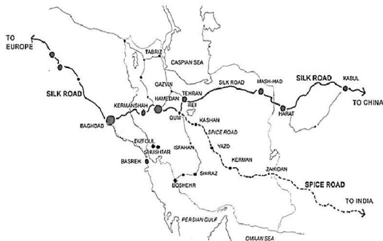
شکل ۱: راه‌های تجاری مهم و جایگاه یزد در مسیر راه ادویه ۴۷

اهمیت صنعتی و بازرگانی یزد، در نیمه نخست قرن بیستم نیز حفظ گردید و این شهر، به‌عنوان قطب اقتصادی ایران مطرح بود. در این شهر بود که راه‌های اصفهان و کاشان از طریق نائین، با راهی که از شیراز از طریق ابرکوه می‌آمد، تلاقی می‌کردند. ۴۸ در واقع، سه شهر عمده تولیدکننده صنایع دستی (اصفهان، کاشان و یزد)، محور اصلی تجارت در شبکه بزرگ بازرگانی داخل و خارج ایران را شکل می‌دادند و در این میان، شهر یزد تا حدودی از موقعیت بهتری برخوردار بود. ۴۹ بی‌تردید، این برتری را باید در امنیت و آرامش یزد در مقایسه با بسیاری از شهرهای دیگر جست‌وجو نمود. ۵۰ همچنین، باید اذعان داشت که حضور زرتشتیان در این شهر (شکل ۲ و ۳)، عاملی بس مهم در رونق این شهر به شمار می‌آمد؛ چراکه قسمت عمده تجارت ایران با روسیه و هند، به ترتیب به‌وسیله هموطنان ارمنی و زرتشتی انجام می‌گرفت. ۵۱