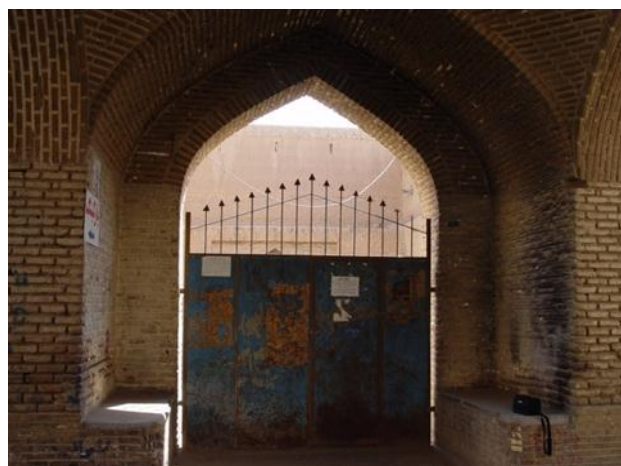
شکل ۷: آب انبار هاشم‌خان در محله گلچینان