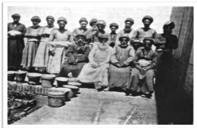
شکل ۲: انجمن زرتشتیان یزد در اواخر عصر قاجار (۱۹۰۳ م) ۵۲