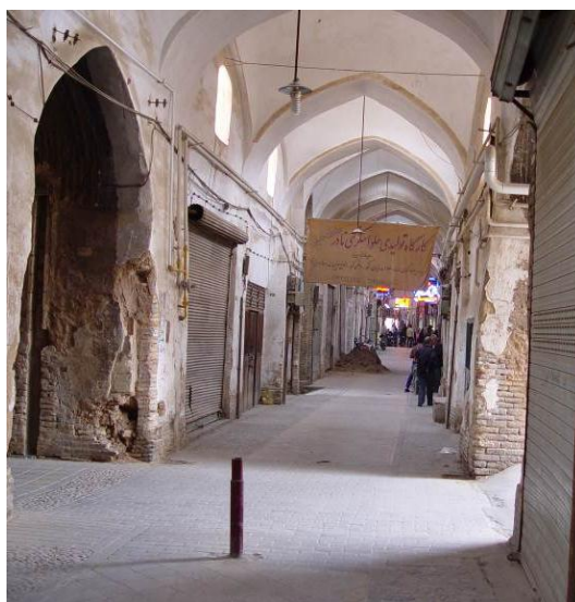
شکل ۹: بازارچه تبریزیان