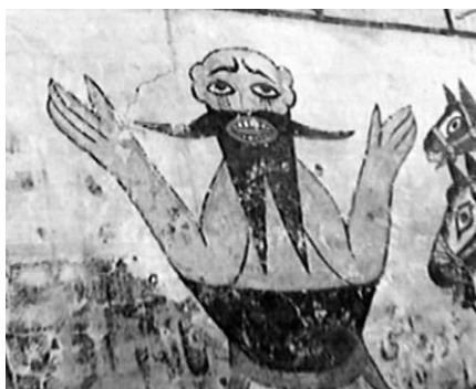
تصویر ۱۰. شکنجه عوامل واقعه کربلا و یزیدیان. بقعه آفاسیدمحمد یمنی بن امام موسی الکاظم علیه السلام واقع در روستای لیچا. عکاسی در سال ۱۳۸۵.