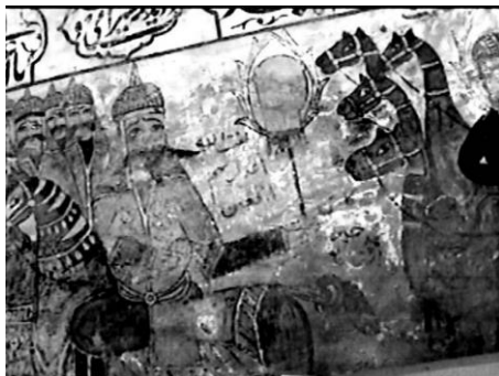
تصویر ۹. بردن سرهای شهدا و سر امام حسین علیه السلام توسط لشکر یزیدیان به شام. بقعه آفاسیدمحمد یمنی بن امام موسی الکاظم علیه السلام واقع در روستای لیچا. عکاسی در سال ۱۳۸۵.