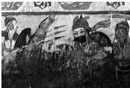
تصویر ۵. نبرد حضرت قاسم علیه السلام با ازرق شامی و پسرانش. فضای داخلی بقعه ملاپیر شمس‌الدین واقع در محله لاشیدان حکومتی لاهیجان. عکاسی در سال ۱۳۸۵.